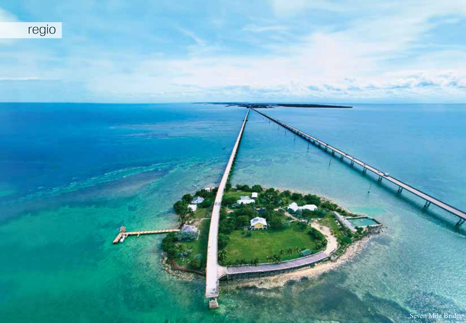
Seven Mile Bridge