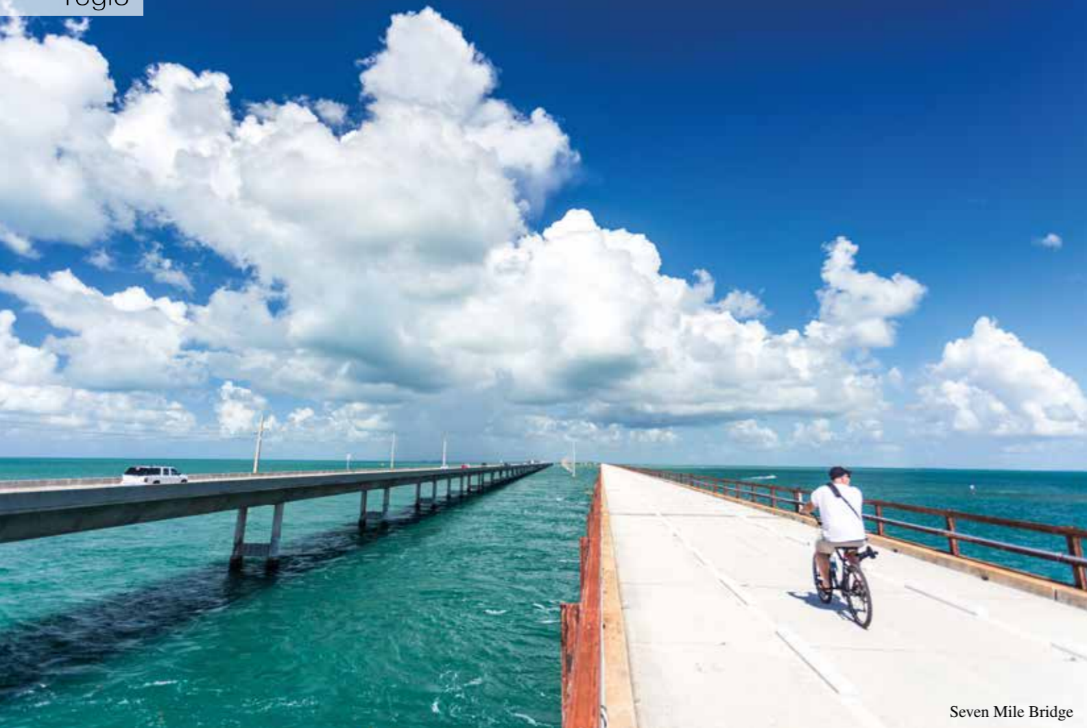
Seven Mile Bridge