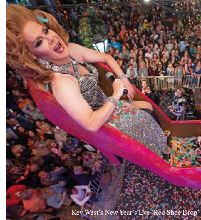
Key West's New Year's Eve 'Red Shoe Drop'